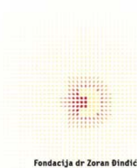
Fondacija dr Zoran Djindjic

Фондација др Зоран Ђинђић је основана 2003. године. Циљеви Фондације су подстицање међународне размене младих људи и стицање професионалног искуства, унапређење демократије и политичке културе, као и промоција научног и политичког деловања др Зорана Ђинђића.